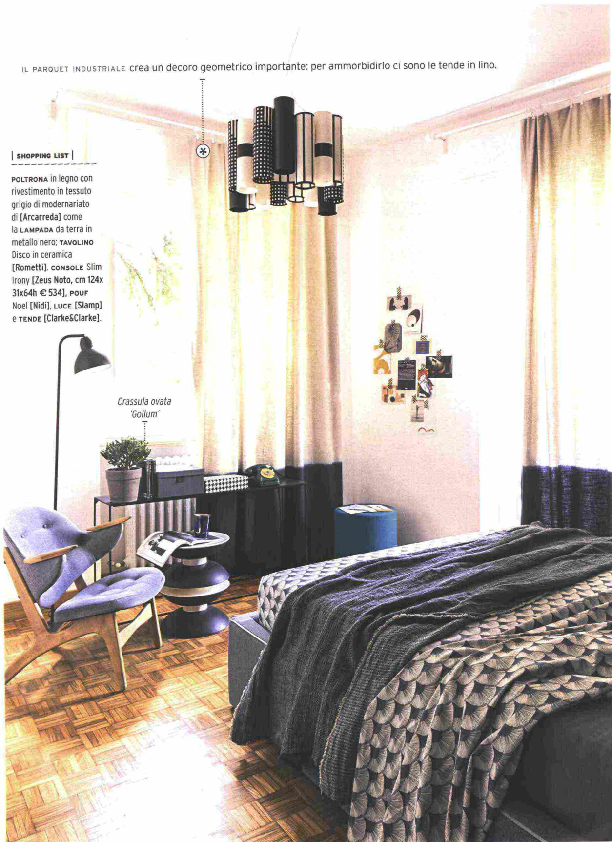
Crassula ovata 'Gollum'

POLTRONA in legno con rivestimento in tessuto grigio di modernariato di [Arcarreda] come la LAMPADA da terra in metallo nero; TAVOLINO Disco in ceramica [Rometti]. CONSOLE Slim Irony [Zeus Noto, cm 124x 31x64h € 534], POUF Noel [Nidi], LUCE [Slamp] e TENDE [Clarke&Clarke].